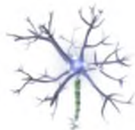
Башкирское общество неврологов

Ведущим специалистам России и зарубежным гостям форума были подарены книжные издания об уникальной природе и достопримечательностях нашей Республики и конечно наш башкирский мед, который был предоставлен компанией «Башкирские пасеки». Участникам нейрофорума были вручены памятные официальные материалы, в том числе единственный в Республике, зарегистрированный специализированный журнал «Неврологический меридиан». Для гостей столицы была организована обзорная экскурсия по городу Уфа. В освещении и поддержке столь крупного научно-практического мероприятия, организованного Башкирским отделением Всероссийского общества неврологов, Башкирским государственным медицинским университетом, Национальной медицинской палатой Республики Башкортостан и Национальным медицинским холдингом «МЕДСТАНДАРТ», приняло активное участие Башкортостанское региональное отделение Всероссийской политической партии «Единая Россия». Благодарим за активную позицию в информировании врачей Министерство здравоохранения Республики Башкортостан.